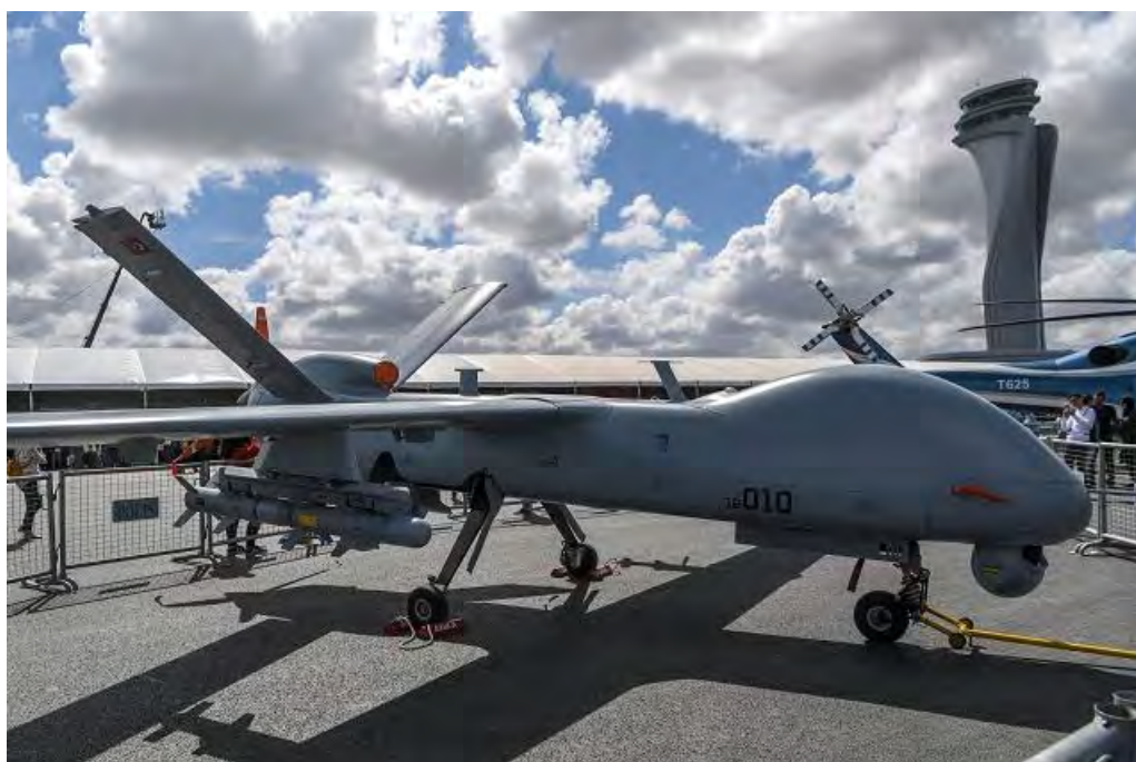
Εικόνα 9. Ένα τουρκικό TAI Anka οπλισμένο με κατευθυνόμενα όπλα αέρος-εδάφους ακριβείας MAM-L με εμβέλεια της τάξης των 10 km.

Εν τω μεταξύ, η General Atomics ίδρυσε την General Atomics Aeronautical Systems, Inc. (GA-ASI), η οποία συνέχισε την εξέλιξη του Gnat, καταλήγοντας στο γνωστό MQ-1 Predator. Έτσι, ο Abe Kareem χαρακτηρίστηκε ως ο “πατέρας των drone” ( Drone father ) από το Economist , λαμβάνοντας υπόψη την προσφορά του στο χώρο. Η Τουρκία ζήτησε την αγορά 6 MQ-1 Predator μέσω FMS το 2008. Οι ΗΠΑ φαίνεται ότι δεν έκαναν δεκτό το αίτημα αυτό. Αντ’ αυτού, απέστειλαν 4 Predator τα οποία στάθμευαν στην Αεροπορική Βάση του Incirlik και επιχειρούσαν υπό τις Τουρκικές ΕΔ για να εποπτεύουν το Ιράκ. Αν και τουλάχιστον ένα εξ αυτών κατέπεσε, η χρήση των πολύ εξελιγμένων Predator επέτρεψε στην γείτονα να αποκτήσει πολύτιμες εμπειρίες σχετικά με τις δυνατότητες των ΜΕΑ.