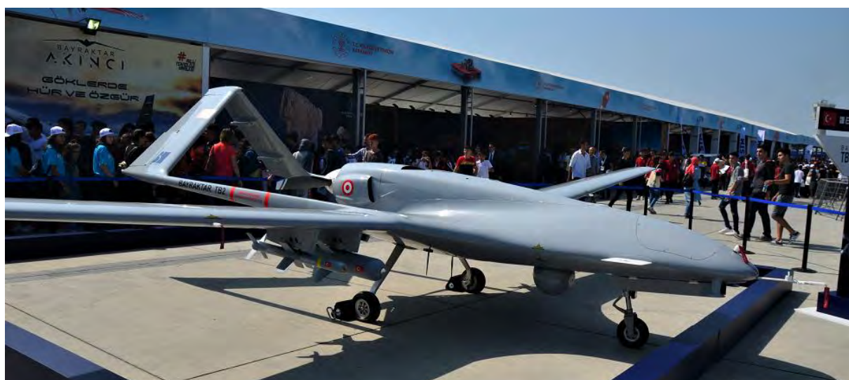
Εικόνα 10. Ένα Bayraktar TB2 της Baykar κατά τη διάρκεια της έκθεσης Teknofest 2019, οπλισμένο με κατευθυνόμενα όπλα αέρος-εδάφους ακριβείας MAM-L και MAM-C ( https://commons.wikimedia.org/wiki/File:BayraktarTB2_Teknofest2019_(1).jpg ).

Το TB2 παρουσιάζει σχετικά μικρό ίχνος στο ραντάρ (RCS), αν και δεν μπορεί να χαρακτηριστεί ως “χαμηλής παρατηρησιμότητας” (stealth). Σύμφωνα με κάποιες εκτιμήσεις, το RCS του εκτιμάται γύρω στα 0,4 m 2 και είναι αρκετά μικρότερο από ό,τι ένα συμβατικό μαχητικό με μέσο RCS γύρω στα 2,5 m 2 . Οι τουρκικές ΕΔ διαθέτουν περί τα 150 αεροχήματα, σε όλους τους Κλάδους. Το κόστος του διαμορφώνεται από 5 έως 15 εκατ. $ ανά σύστημα (αερόχημα συν σταθμός ελέγχου), αναλόγως διαμόρφωσης και φερομένων αισθητήρων, ενώ το αερόχημα μόνο του εκτιμάται γύρω στα 2 εκατ. $.