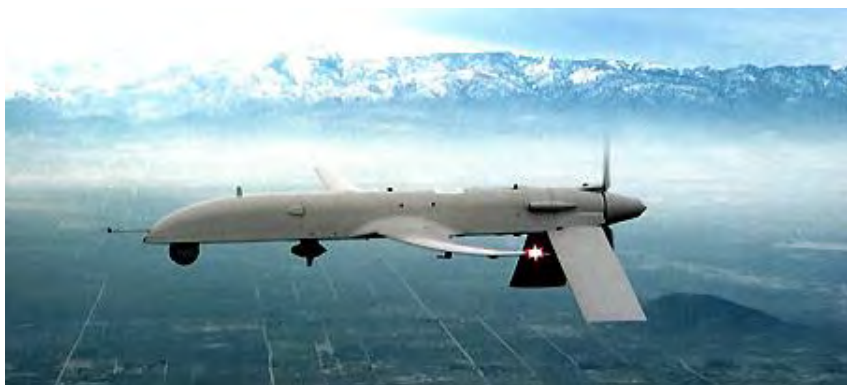
Εικόνα 7. Το I-Gnat ER της General Atomics περιπολεί πάνω από το Ιράκ το 2004. Η Τουρκία διαθέτει 6 Gnat 750 και 16 I-Gnat ER.

Μειονέκτημα: Περαιτέρω αποθράσυνση της Τουρκίας, εκτός εάν αναχαιτίζονται συνεχώς και κατ' εξακολούθηση τα τουρκικά UAV, γεγονός που συνεπάγεται ιδιαίτερο οικονομικό κόστος από πλευράς μας και αντίστοιχη καταπόνηση του προσωπικού και των μέσων μας.