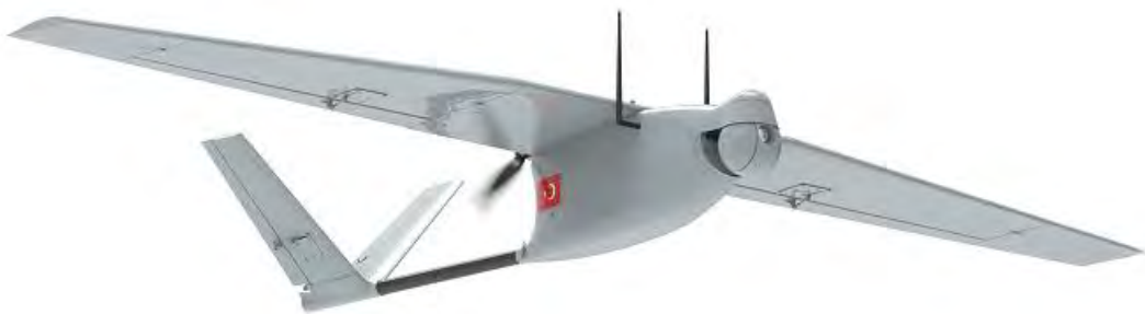
Εικόνα 15. Το μικρό ΜΕΑ Bayraktar Mini της Baykar, εμβελείας 15 km.

Baykar Bayraktar Mini UAV. Με πρώτη πτήση το 2006, το Bayraktar Mini της Baykar έχει μήκος 35 cm, εκπέτασμα 43 cm και βάρος 10 kgr. Διαθέτει ηλεκτρικό κινητήρα και επιτυγχάνει ταχύτητα 30/40 kn (cruise/max), μέγιστο ύψος πτήσης 2.000 ft, εμβέλεια 15 km με αυτονομία έως 80'. Είναι εξοπλισμένο με κάμερα για τακτική αναγνώριση και επιτήρηση ημέρας/νύκτας. Η Τουρκία διαθέτει περίπου 500 Bayraktar Mini.