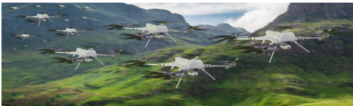
Εικόνα 19. Το Swarm Intelligence UAV Project (Bumin) της STM: μικρά τετρακόπτερα ΜΕΑ που λειτουργούν ως ένα ευφυές σμήνος (swarm). Γενικώς, ένα σμήνος ευφυών drone είναι πρακτικά αδύνατο να αναχαιτισθεί πλήρως.