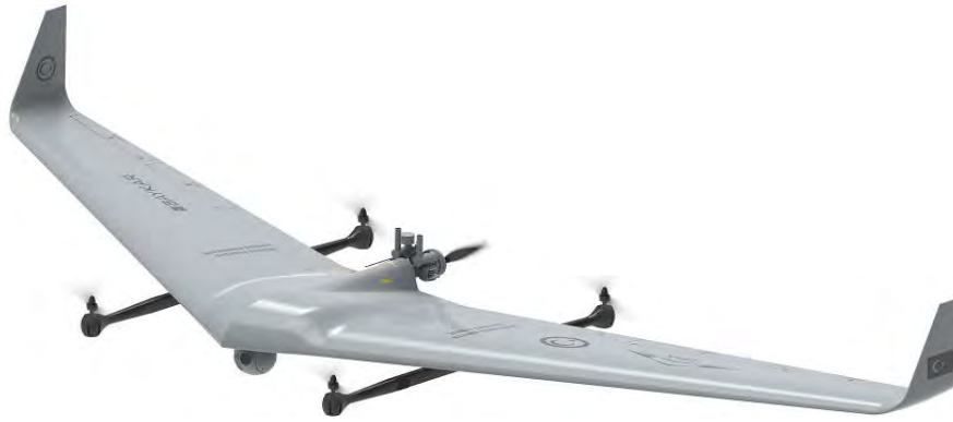
Εικόνα 18. Το Bayraktar TB2 της Baykar: ένα μικρό αεροπλάνο κάθετης απο/προσγείωσης, μέγιστου βάρους 50 kg. Μετά την απογείωση με την βοήθεια των 4 ηλεκτρικών κινητήρων του, τίθεται σε λειτουργία πλεύσης, όπου λειτουργεί μόνο ο κινητήρας εσωτερικής καύσεως, με μέγιστη ταχύτητα 80 knots και μέγιστο ύψος πτήσης 15.000 ft. Θα χρησιμοποιείται για αποστολές αναγνώρισης και συλλογής πληροφοριών.