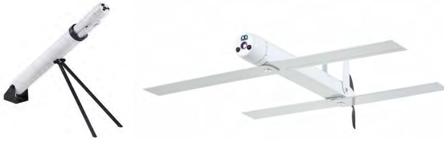
Εικόνα 17. Το μικρό MEA Alpagu της STM, για αναγνώριση και κρούση, εμβελείας 10 km.

Στην περίπτωση των μικρών MEA προφανώς δεν προτείνεται η αξιοποίηση μαχητικών ή μεγάλων αντιαεροπορικών πυραύλων. Αντιθέτως, επειδή ενδεχομένως να μιλάμε για αστικό περιβάλλον, απαιτείται προσοχή και ανάλογα συντηρητική προσέγγιση. Έτσι, για την αντιμετώπιση - εμπλοκή των μικρών MEA προτείνονται τα ακόλουθα: