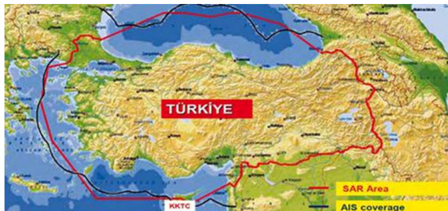
Εικόνα 4. Χάρτης Αυθαίρετων Διεκδικήσεων Ε-Δ Τουρκίας

Το 1996, έχουμε αμφισβήτηση εθνικού χώρου στα Ίμια και την εξύφανση της θεωρίας των “γκρίζων ζωνών”. Ταυτόχρονα, εντείνονται οι αμφισβητήσεις για Ε-Δ (Έρευνα και Διάσωση), για χρήση του LINK 16 πάνω από Ελληνικά Νησιά (βλ. Εικόνα 4), κλπ.