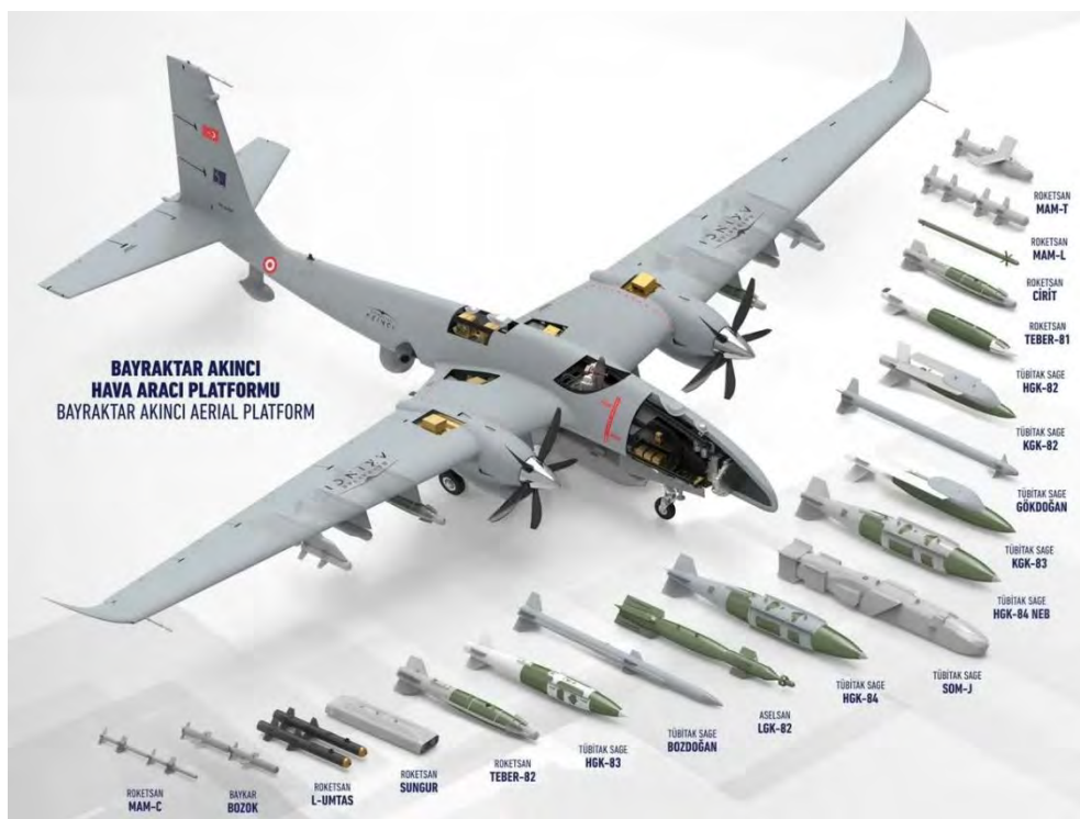
Εικόνα 13. Απεικόνιση του Akinci της Baykar με τα όπλα που αναμένεται να πιστοποιηθούν, συμπεριλαμβανομένου του πυραύλου πλεύσης (cruise) SOM ( https://www.oryxspioenkop.com/2022/01/endless-possibilities-bayraktar-akncs.html ).

αισθητήρες, μεταξύ των οποίων και ραντάρ ηλεκτρονικής σάρωσης AESA (Active Electronically Scanned Array), ενώ επίσης δεν θα εξαρτάται από το GPS. Επίσης, θα φέρει πολλά και σημαντικά όπλα, όπως MAM-L/MAM-C, κατευθυνόμενες βόμβες Teber και JDAM, τα όπλα αερομαχίας Gokdogan (αντίστοιχος του AIM-120 AMRAAM), Bozdogan (αντίστοιχος του AIM-9 Sidewinder), καθώς και τον τουρκικό πύραυλο πλεύσης (cruise) SOM (Stand Off Missile). Ο τελευταίος, αν και δεν έχει ακόμα πιστοποιηθεί στο Akinci, αποτελεί ένα πολύ ικανό όπλο, με μεγάλη εμβέλεια πάνω από 250 km, με πολεμική κεφαλή 500 λιβρών, δυνατότητα πλοήγησης με αδρανειακό και GPS, τερματική καθοδήγηση με αισθητήρα IIR (Imaging Infrared), ανάλογα με την έκδοσή του. Σύμφωνα με ανοικτές πηγές, η Τουρκία έχει τοποθετήσει παραγγελία για 495 SOM διαφόρων εκδόσεων , οι περισσότεροι εκ των οποίων έχουν ήδη κατασκευαστεί. Διαπιστώνεται λοιπόν ότι η Τουρκία σταδιακά σταματά να εξαρτάται από τα συνήθη μαχητικά, αναθέτοντας όλο και περισσότερους ρόλους στα MEA/MEAΚ.