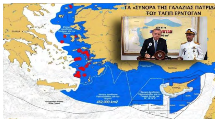
Εικόνα 5. Θεωρία Γαλάζιας Πατρίδας

Η άνοδος του Ερντογάν μετασχημάτισε τα σχέδια (όχι τις διεκδικήσεις) της Τουρκίας σε βάρος της Ελλάδας, με μία νέα καινοφανή θεωρία για την Γαλάζια Πατρίδα, που ανακεφαλαίωσε τις τουρκικές επιδιώξεις (νησιά, ΑΟΖ, Κύπρος... βλ. χάρτη στην Εικόνα 5).