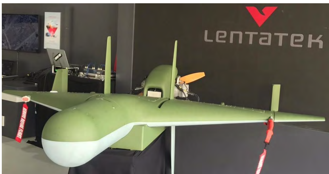
Εικόνα 20. Το περιφερόμενο πυρομαχικό Kargi της εταιρείας Lentatek, όπως παρουσιάστηκε πρόσφατα στην άσκηση EFES-2022 στην Τουρκία, για καταστολή και καταστροφή των εχθρικών ραντάρ. Οι ομοιότητες είναι κάτι παραπάνω από προφανείς με το Harpy της IAI, το οποίο και πρόκειται να αντικαταστήσει ( https://www.dailysabah.com/business/defense/turkeys-new-kamikaze-uav-kargi-debuts-in-aegean-drill ).

Στον καιρό ειρήνης που ζούμε, η πολιτική επιλογή του τι θα κάνουμε ως προς την αντιμετώπιση της παράνομης συμπεριφοράς των τουρκικών ΜΕΑ δεν πρέπει να καθυστερήσει, γιατί αυτά μας δημιουργούν σοβαρό θέμα εθνικής ασφάλειας, θέμα ασφάλειας της εναέριας κυκλοφορίας στο FIR Αθηνών, αλλά και θέμα αναξιοπιστίας ως προς την βούληση υπεράσπισης της κυριαρχίας μας, ενώ δεν πρέπει να αφήσουμε να αποθρασυνθούν οι γείτονες. Προτείνεται ξεκάθαρα η κατάρριψη τουρκικού ΜΕΑ , εάν πετάξει παράνομα πάνω από εθνικό έδαφος ή χωρικά ύδατα. Εννοείται ότι θα πρέπει να έχει προηγηθεί ανάλογη προετοιμασία, τόσο σε στρατιωτικό επίπεδο, όσο και σε διπλωματικό επίπεδο, με ανάλογη ανοικτή προειδοποίηση, καθώς και ενημέρωση συμμαχικών κρατών. Διαφορετικά, θα διολισθαίνουμε αργά και σταθερά στον κατευνασμό, την παραχώρηση, την απάθεια, την αδράνεια και την ανυπαρξία.