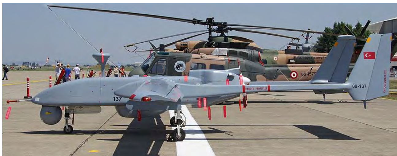
Εικόνα 8. Ένα τουρκικό IAI Heron.

Ιστορική αναδρομή. Σημειώνεται ότι η ανάλυση των συστημάτων που διαθέτει η Τουρκία θα ξεκινήσει με τα μεσαία και μεγάλα ΜΕΑ, ενώ στη συνέχεια θα γίνει αναφορά και στα μικρότερα drone. Η Τουρκία εισήλθε στον χώρο των ΜΕΑ πολύ αργότερα από την Ελλάδα και πιο συγκεκριμένα το 1993, όταν παρήγγειλε 6 ΜΕΑ Gnat 750 (προφέρεται “νατ” και σημαίνει σκνίπα). Το Gnat 750 αναπτύχθηκε από την αμερικανική εταιρεία Leading Systems Inc. (LSI), την οποία είχε ιδρύσει ο ισραηλινός καταγωγής Abe Kareem και η οποία αργότερα απορροφήθηκε από την επίσης αμερικανική General Atomics. Η Τουρκία το 1996 παρέλαβε τα 6 Gnat 750 (με μέγιστο βάρος απογείωσης περίπου 500 kg) και στη συνέχεια 16 εξελιγμένα I-Gnat ER (με μέγιστο βάρος απογείωσης περίπου 700 kg), ενώ σύμφωνα με κάποιες πηγές σήμερα διαθέτει συνολικά 18 Gnat.