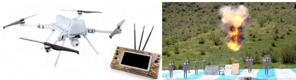
Εικόνα 16. Το μικρό αυτοκτονικό τετρακόπτερο Kargu της STM, εμβελείας 5 km.

κατάφεραν να ξεφύγουν από τις άμυνες του πλοίου. Έκτοτε οι δυνατότητες των drone έχουν εξελιχθεί θεαματικά. Η κατάσταση αναμένεται να γίνει πολύ πιο δυσχερής για τον αμυνόμενο, όταν πρόκειται για εκατοντάδες ή και χιλιάδες drone, τα οποία επικοινωνούν μεταξύ τους, ιδίως εάν διαθέτουν τεχνητή νοημοσύνη, με δυνατότητα μάθησης.